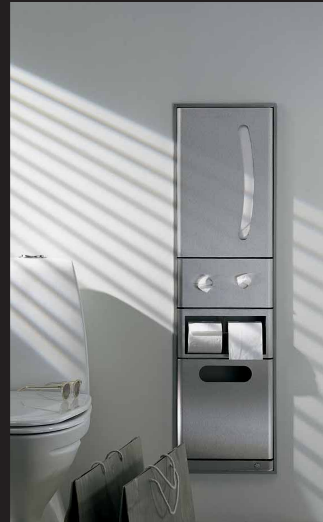
Satin stainless steel (AISI 316 WST 1.4305)

Kertakäyttömukit 14.7099.00 21 cl. kertakäyttömukeja Laatikossa 30 x 100 kpl. koodi 000